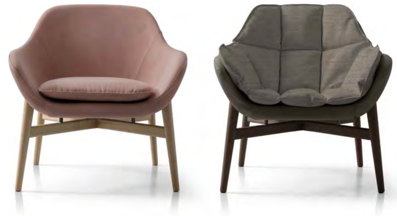
Materassino trapuntato in piuma d'oca Quilted cushion goose feather L 50 P 57 H 50